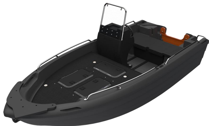
(Abbildung entspricht Catch Edition)