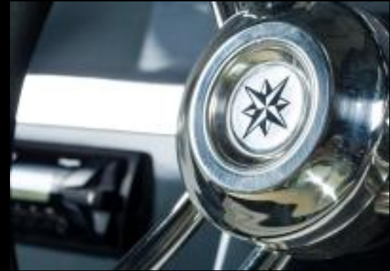
Valory V440 Open