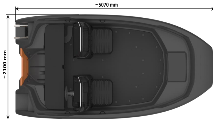
(Abbildung enthält Zubehörartikel)